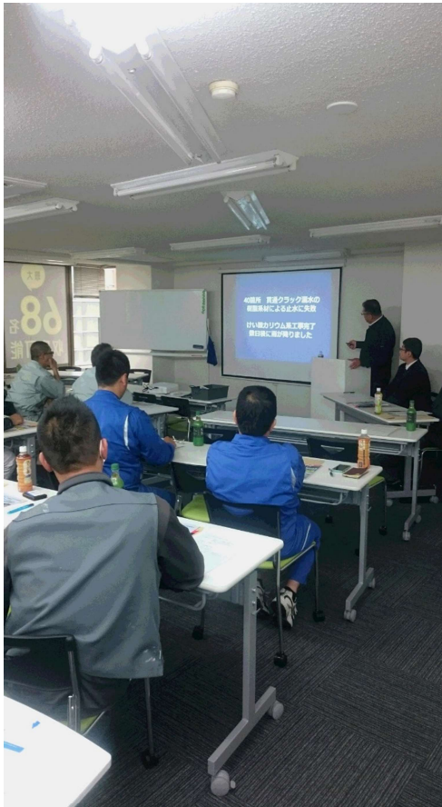
（セミナー開催状況）

14年間の実績に基づく説明で、今までのメンブレン防水の常識を大きく変えるセミナーとなったかと思えます。