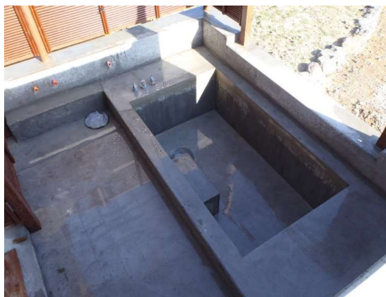
（セミナーで紹介された写真） 浴槽の防水状況

一般社団法人コンクリート改質協会主催のはじめてのセミナーで、防水や止水がテーマでした。 今までの常識を覆す工法で、低コストで長期間効果を持続できる技術である事を再確認しました。 防水には寿命（10～15年程度）があり、改修時には既存の防水層を撤去することが多いですが、含浸材であれば既存防水層を撤去することなく再施工が可能となります。 ともに普及活動に協力していただけることをお願いします。