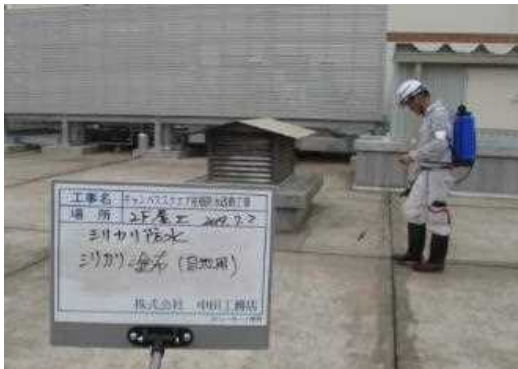
③ 目地部へシリカリ塗布 (注入)