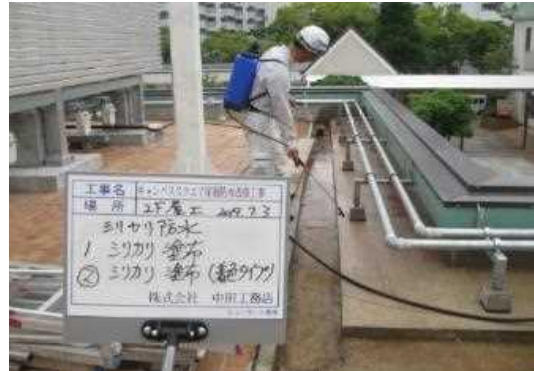
① 既設シングルコンクリート上からシリカリ塗布 (2回目着色タイプ)