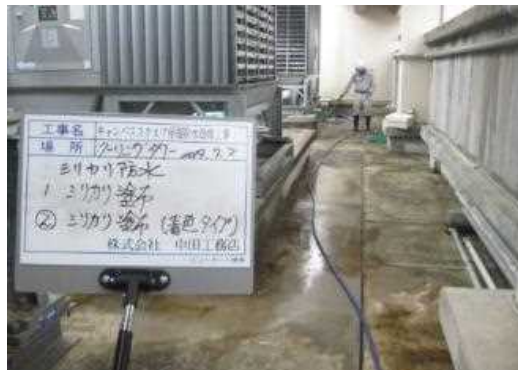
⑤ 塗布後の散水洗浄