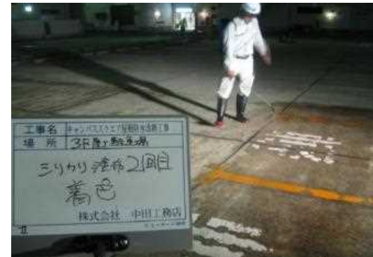
④ 立体駐車場屋上へシリカリ塗布 (2回目着色タイプ)