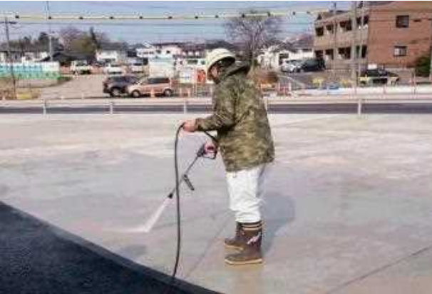
②塗布面を入念に高圧洗浄