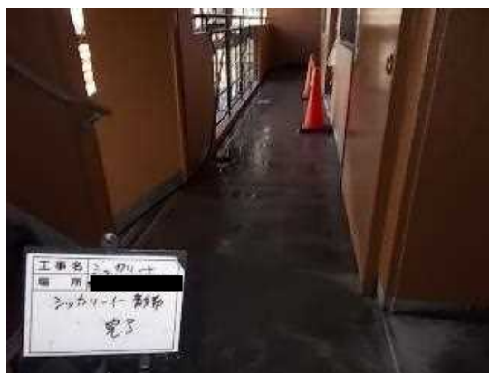
シッカリート散布完了