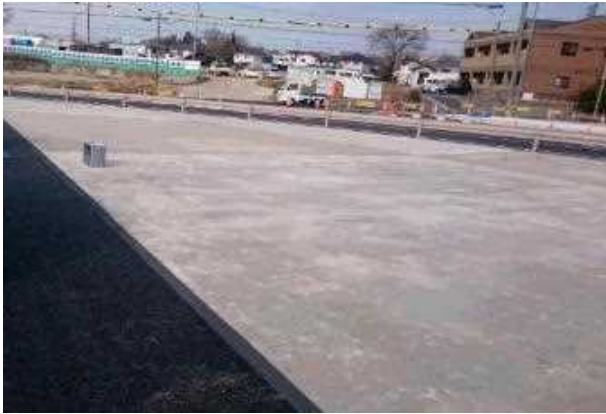
着工前 交差点張りコン部