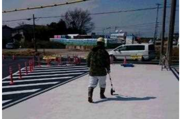
①塗布面積を計測 (塗布量を決めます)