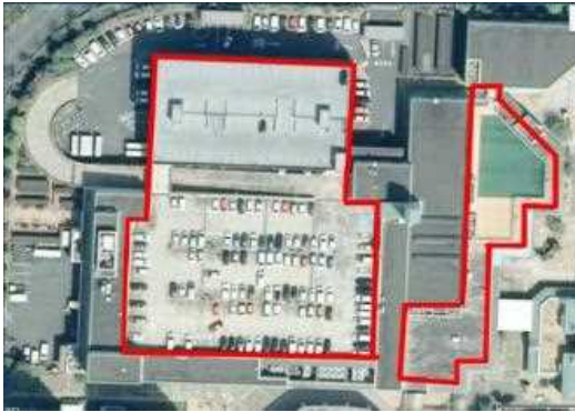
① 着工前 (赤線内が塗布範囲)