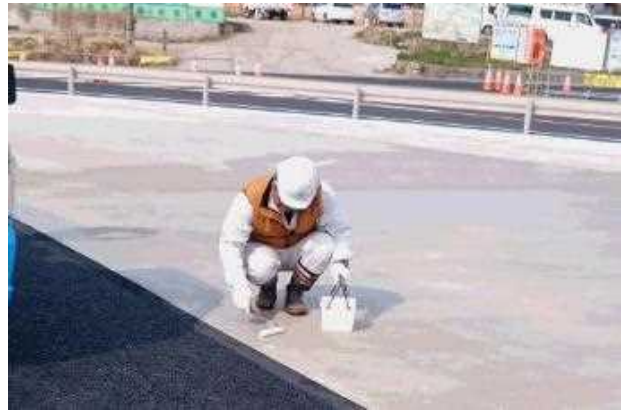
③端部はローラーで、シリカを塗布