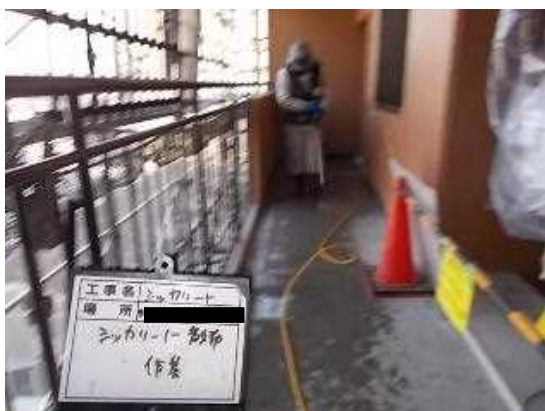
シッカリート散布