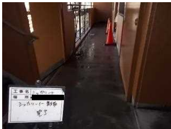
シッカリート散布完了