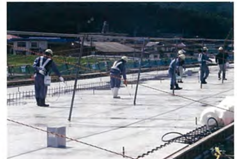
国道54号里熊大橋ひび割れ抑止対策