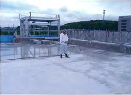
愛知県 店舗 新築防水