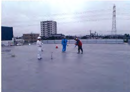
岐阜県 店舗 新築防水