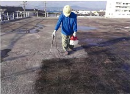
愛知県 店舗 立駐 止水 防水