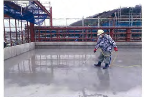
奈良県 店舗 新築防水