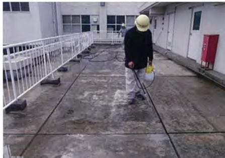
愛知県 大同大学 シンダー 止水