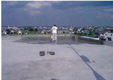
浜松市 ミニテック マンション屋上 防水