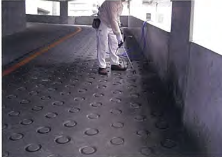
静岡県 店舗 立駐 止水