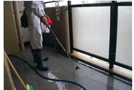
静岡県 マンション ベランダ 止水