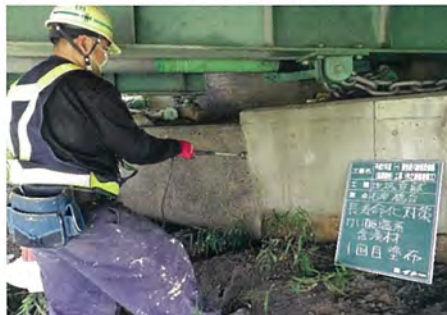
静岡県 今之浦川橋 長寿命化対策