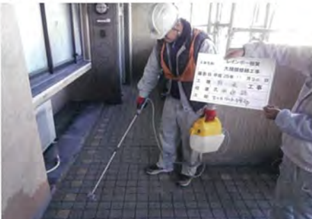
愛知県 マンション 通路 防水