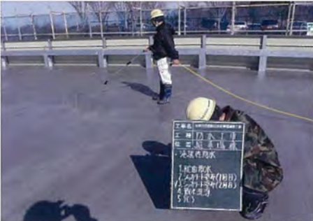
愛知県 新築 立駐 防水