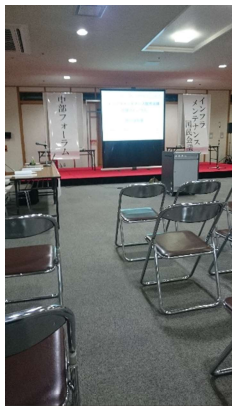
① マッチングイベント会場の様子